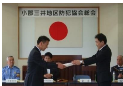
平安市長から表彰を受ける野崎社長